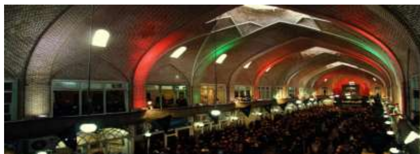
شکل (۴). مراسم عاشورای حسینی - مظفریه