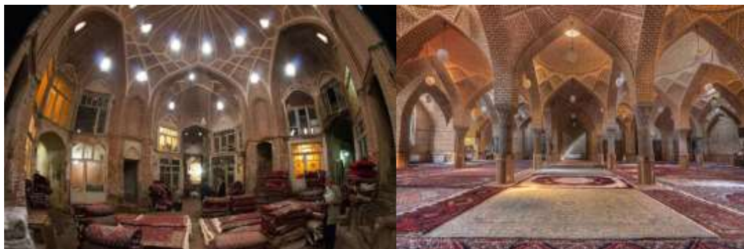
شکل (۲). مسجد مولانا