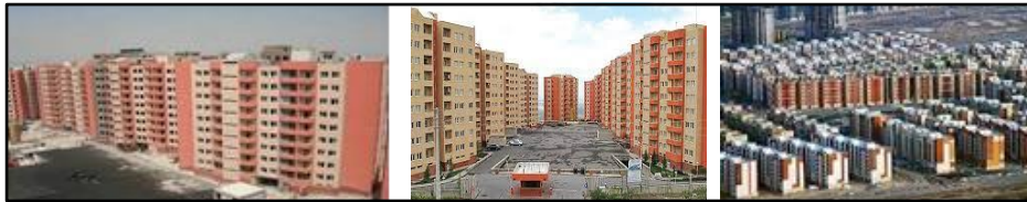
شکل ۱: دورنمای چند نمونه از مجتمع‌های مسکونی شهر سهند Fig.1: Perspectives of some examples of residential complexes in Sahand city

شهر جدید سهند تبریز نمونه‌ای از این شهرها است. در این شهر هر ساله، صدها پروژه مسکونی تحت عنوان مسکن شخصی، مسکن انبوه، مسکن استیجاری و مسکن مهر با رعایت الگوی ساخت وزارت مسکن و شهرسازی، برنامه‌ریزی، طراحی و اجراء می‌شود (شکل ۱). سؤال اساسی که مطرح می‌شود این است که کیفیت فضاهای باز و سبز در فضاهای مسکونی شهر جدید سهند چگونه است؟ با توجه به ناچیز بودن اندازه فضاهای معماری و مسکونی، آیا عناصر و عوامل زیست‌محیطی مجتمع‌های مسکونی توانسته‌اند به نیازهای فردی و اجتماعی و نیز رضایت و غنای حسی ساکنین پاسخ دهند؟