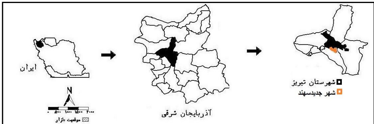
شکل ۲: موقعیت شهر جدید سهند در منطقه تبریز

بسیار سرد و سخت و تابستان نسبتاً گرم و خشک می‌باشد. میانگین دمای هوا در تابستان حدود 21/10^{\circ}\text{C} و در زمستان حدود 1/8^{\circ}\text{C} می‌باشد. حداکثر دمای هوا در ماه تیر با 23/8^{\circ}\text{C} ، و کمینه آن 3^{\circ}\text{C} در ماه دی است. تعداد روزهای یخبندان 130/2 روز در سال می‌باشد. گرچه جمعیت شهر جدید سهند در مطالعات مکانیابی اولیه ۳۰۰ هزار نفر پیش‌بینی شده بود لیکن جمعیت آن در آمارگیری سال ۱۳۹۵، کمتر از ۲۰ هزار نفر اعلام گردید. طراحی شهر سهند به‌نحوی است که مسیرهای پیاده و سواره در داخل محلات از یکدیگر تفکیک شده است. طرح کریدور پیاده جدا از ایمن سازی، ترویج فرهنگ پیاده‌روی و همچنین غنا بخشیدن به مناظر شهری باعث برقراری ارتباطات اجتماعی بین ساکنان واحدهای همسایه در این بخش از شهر نیز شده است.