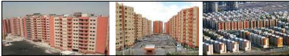
شکل ۱: دورنمای چند نمونه از مجتمع‌های مسکونی شهر سهند Fig.1: Perspectives of some examples of residential complexes in Sahand city

شهر جدید سهند تبریز نمونه‌ای از این شهرها است. در این شهر هر ساله، صدها پروژه مسکونی تحت عنوان مسکن شخصی، مسکن انبوه، مسکن استیجاری و مسکن مهر با رعایت الگوی ساخت وزارت مسکن و شهرسازی، برنامه‌ریزی، طراحی و اجراء می‌شود (شکل ۱). سؤال اساسی که مطرح می‌شود این است که کیفیت فضاهای باز و سبز در فضاهای مسکونی شهر جدید سهند چگونه است؟ با توجه به ناچیز بودن اندازه فضاهای معماری و مسکونی، آیا عناصر و عوامل زیست‌محیطی مجتمع‌های مسکونی توانسته‌اند به نیازهای فردی و اجتماعی و نیز رضایت و غنای حسی ساکنین پاسخ دهند؟