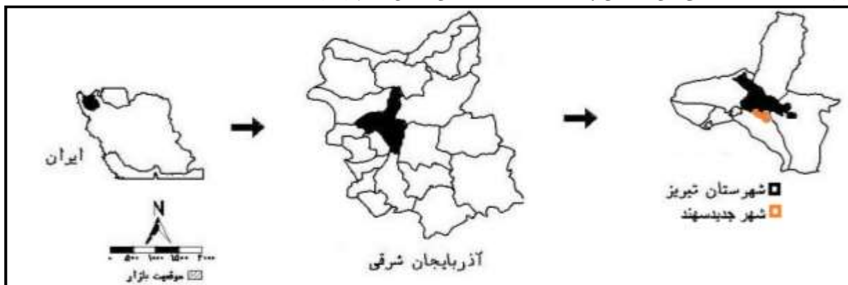
شکل ۲: موقعیت شهر جدید سهند در منطقه تبریز

بسیار سرد و سخت و تابستان نسبتاً گرم و خشک می‌باشد. میانگین دمای هوا در تابستان حدود 21/10^{\circ}\text{C} و در زمستان حدود 1/8^{\circ}\text{C} می‌باشد. حداکثر دمای هوا در ماه تیر با 23/8^{\circ}\text{C} ، و کمینه آن 3^{\circ}\text{C} در ماه دی است. تعداد روزهای یخبندان 130/2 روز در سال می‌باشد. گرچه جمعیت شهر جدید سهند در مطالعات مکانیابی اولیه ۳۰۰ هزار نفر پیش‌بینی شده بود لیکن جمعیت آن در آمارگیری سال ۱۳۹۵، کمتر از ۲۰ هزار نفر اعلام گردید. طراحی شهر سهند به‌نحوی است که مسیرهای پیاده و سواره در داخل محلات از یکدیگر تفکیک شده است. طرح کریدور پیاده جدا از ایمن سازی، ترویج فرهنگ پیاده‌روی و هم‌چنین غنا بخشیدن به مناظر شهری باعث برقراری ارتباطات اجتماعی بین ساکنان واحدهای همسایه در این بخش از شهر نیز شده است.