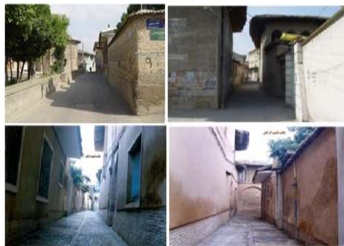
شکل ۴: محلات بافت قدیمی شهر گرگان